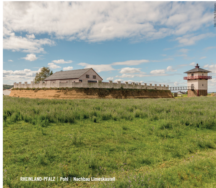
RHEINLAND-PFALZ | Pohl | Nachbau Limeskastell

Abschnitt 1 Der Deutsche Limes-Radweg beginnt an der deutsch-niederländischen Grenze bei Kleve in Nordrhein-Westfalen und folgt dem Rheinradweg Euro Velo 15 entlang des Rheins. Entlang der Strecke passiert man einige Städte mit römischer Vergangenheit, wie Xanten, Duisburg, Düsseldorf, Neuss, Köln und Bonn bis nach Remagen in Rheinland-Pfalz.