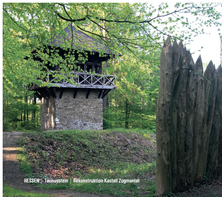
HESSEN | Taunusstein | Rekonstruktion Kastell Zugmantel

Abschnitt 3 Auf diesem Abschnitt ist Kondition gefragt, denn hier geht es bergauf und bergab. Zuerst wird die hessische Landesgrenze überschritten. Anschließend führt die Tour durch den Taunus mit seinen gut sichtbaren Spuren von Kastellen, Wachtürmen, Limeswall und -graben. Dicht am Limes entlang geht es in nordöstlicher Richtung zur Saalburg, dem einzigen fast vollständig wieder errichteten Kastell am Limes. Hier bietet sich ein Abstecher in die Kurstadt Bad Homburg an. Malerische Ortschaften wie Butzbach säumen den weiteren Verlauf der Strecke und laden zur Rast ein.