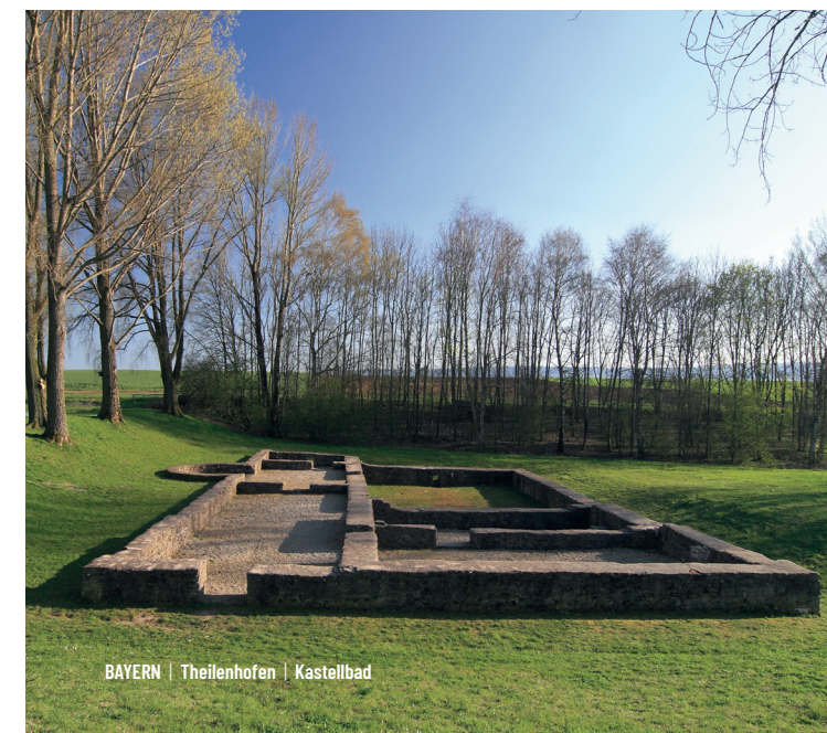
BAYERN | Theilenhofen | Kastellbad

Abschnitt 7 Dieser Streckenabschnitt beginnt nochmals mit einigen hügeligen Passagen. Nahe am Limes entlang geht es nach Kipfenberg und durch den Naturpark Altmühltal. Kurz vor Kelheim stößt der Limes-Radweg auf die Donau. Ab hier folgt er dem Donau-Radweg und führt weiter nach Regensburg.