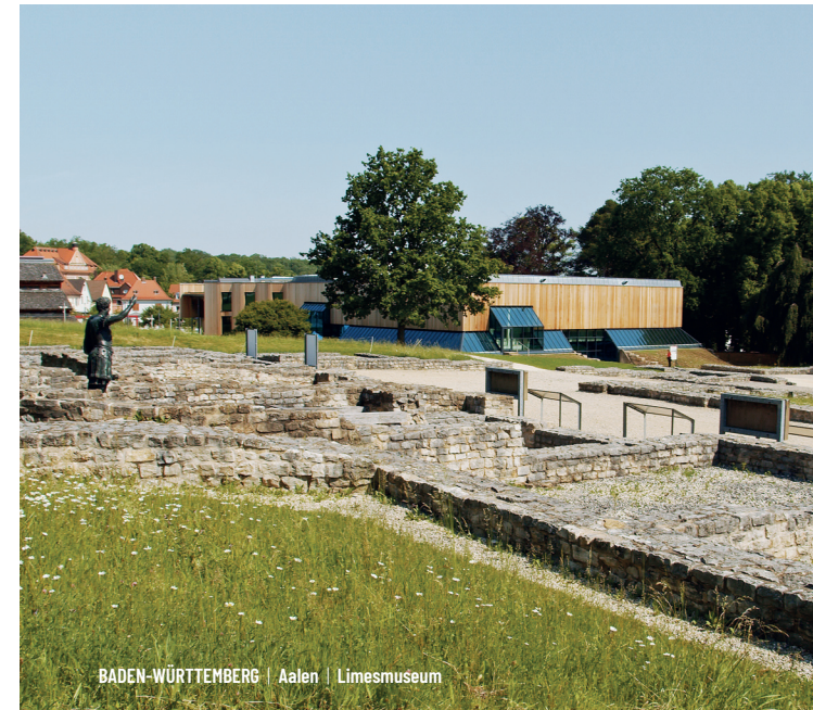
BADEN-WÜRTTEMBERG | Aalen | Limesmuseum

Abschnitt 5 Kurz nach Miltenberg verlässt der Radweg den Main und führt stetig bergan bis Walldürn. Von dort geht es weiter durch den Odenwald entlang des Limes bis nach Osterburken. Der Radweg folgt den Spuren des obergermanischen Limes durch die Hohenloher Ebene, den Naturpark Schwäbisch-Fränkischer Wald und passiert Städte wie Öhringen, Murrhardt oder Welzheim mit ihrem reichen historischen Erbe. In Lorch treffen der obergermanische und der raetische Limes aufeinander.